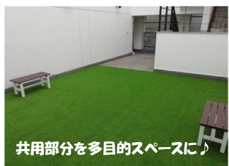
共用部分を多目的スペースに♪